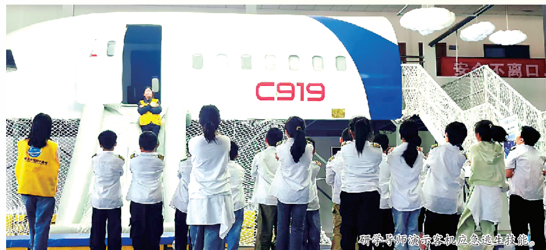
研学导师演示客机应急逃生技能。