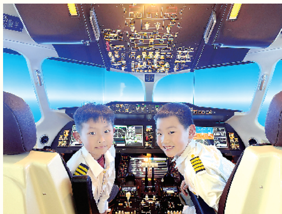
小记者走进模拟驾驶舱。