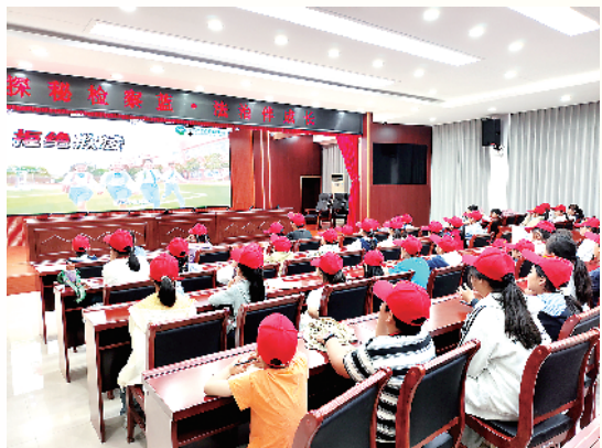
小记者认真观看普法专题片《拒绝校园欺凌》。