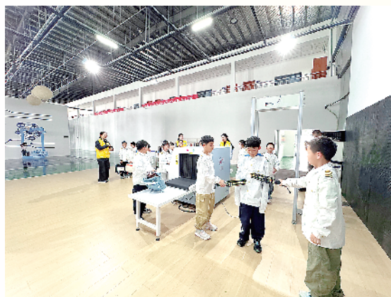
小记者扮演安检员体验安检流程。