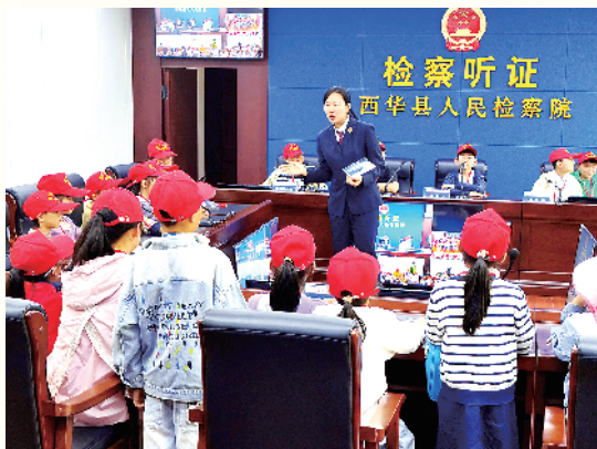
检察官细致讲解检察听证工作流程。