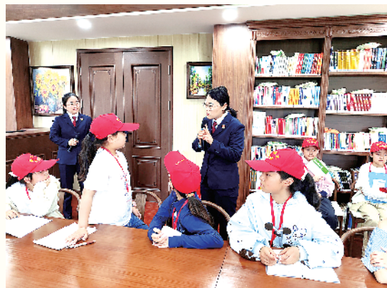
检察官向小记者普及关于未成年人保护的法律知识。